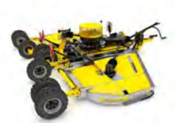
MULCHER Tocătoare rotative

BEDNAR FMT s.r.o. Dlouhá Ves 188 516 01 Rychnov nad Kněžnou Česká republika