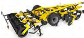
ACTROS Cultivatoare combinate