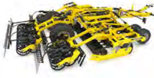
ATLAS Grape cu discuri