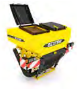
FERTI-BOX Buncăre de îngtășăminte