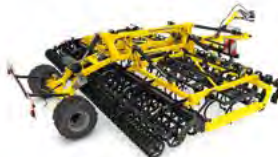
SWIFTER Combinatoare pentru pat germinativ