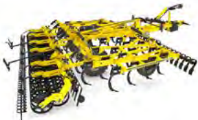
VERSATILL Cultivatoare universale