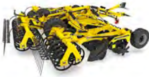
SWIFTERDISC Grape cu discuri