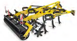
FENIX Cultivatoare universale