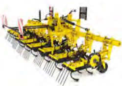
ROW-MASTER Cultivatoare între rânduri