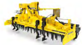
KATOR Grapa rotativă