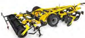
ACTROS Kultywatory kombinowany