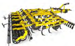
VERSATILL Kultywatory uniwersalne