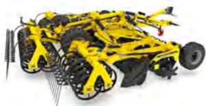
SWIFTERDISC Brony talerzowe