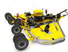
MULCHER Rozdrabniacze rotacyjne

BEDNAR FMT s.r.o. Dlouhá Ves 188 516 01 Rychnov nad Kněžnou Česká republika