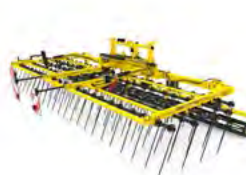
STRIEGEL-PRO Brony do słomy