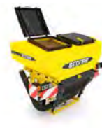
FERTI-BOX Zbiorniki na nawóz