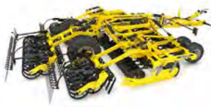
ATLAS Brony talerzowe