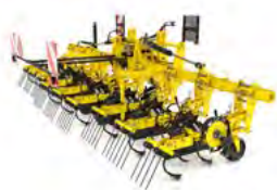
ROW-MASTER Pielnik międzyrzędowy