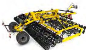
SWIFTER Agregaty przedsiewne