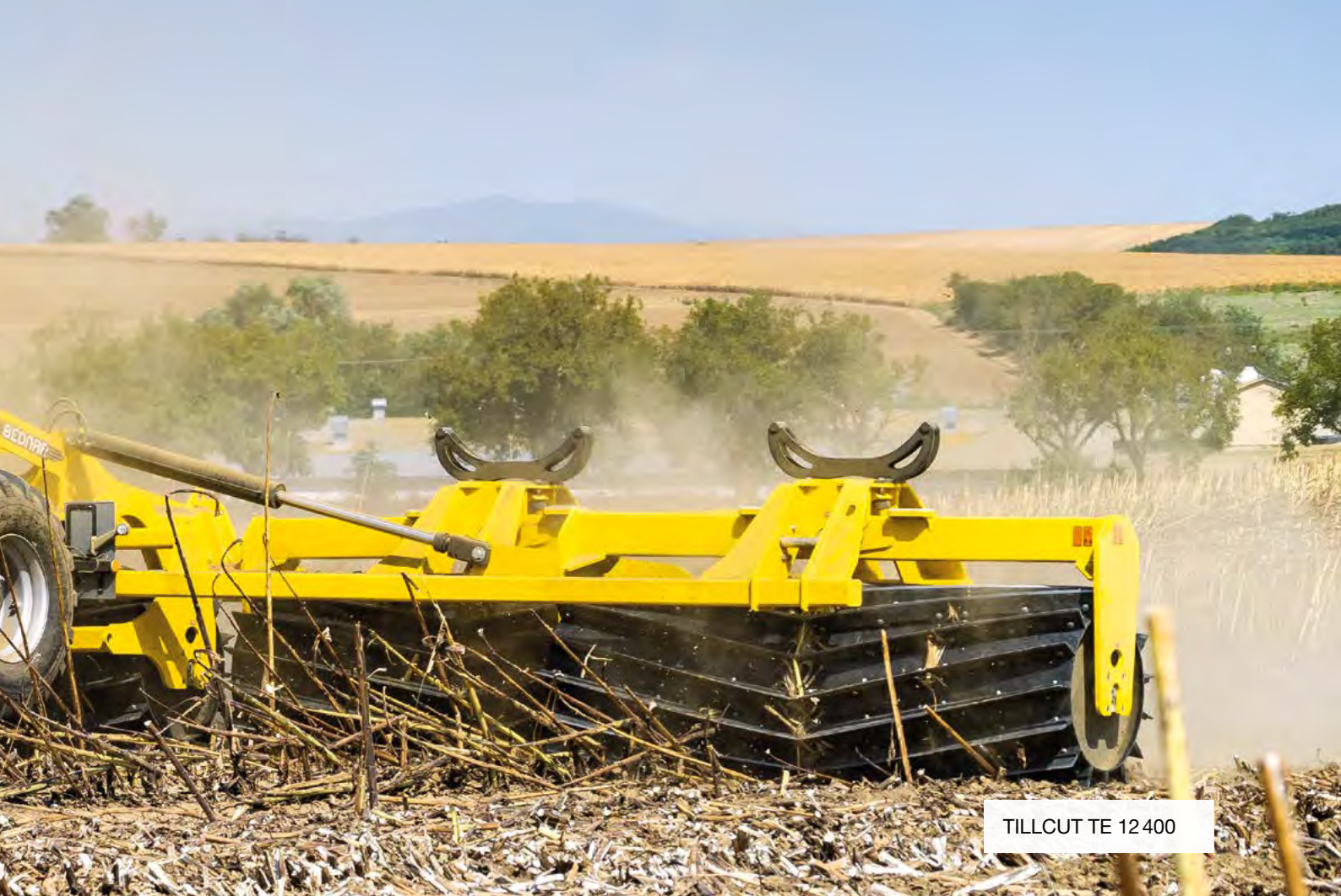
TILLCUT TE 12400

BEDNAR TILLCUT TE to wały tnące o średnicy 890/914/940 mm, zapewniające płytką obróbkę wierzchniej warstwy gleby, co jest typowe dla systemów uprawy pionowej – vertical tillage. Technologia ta minimalizuje naruszenie struktury gleby, zwłaszcza w kierunku poziomym. Spulchniana jest tylko górna warstwa gleby, przy czym zachowana pozostaje kapilarność gleby. Rezultatem jest niezawodne zatrzymywanie wody w glebie, ograniczenie erozji i bardzo dobre warunki dla kiełkowania nasion. Umieszczenie noży powoduje efekt stopniowego rozdzielania gleby, co zapewnia jej dobre kruszenie i eliminuje powstawanie większych grudek. Maszyna jest przeznaczona głównie do obróbki najbardziej odpornych resztek roślinnych (na przykład po kukurydzy ziarnowej, rzepaku ozimym lub słoneczniku), pobudzenia wzrostu chwastów lub mechanicznej likwidacji szkodników. TILLCUT TE jest dostępny w szerokościach roboczych 7,5 i 12,5 metra.