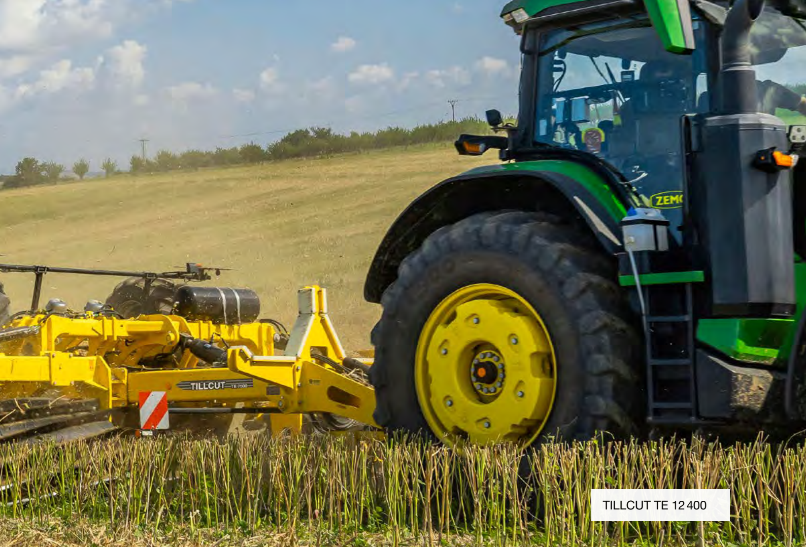
TILLCUT TE 12400