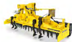
KATOR Brony wirnikowe