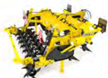
TERRALAND Pługi dłutowe