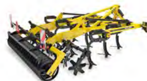
FENIX Kultywatory uniwersalne