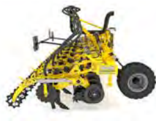
STRIP-MASTER Kultywatory do uprawy pasowej