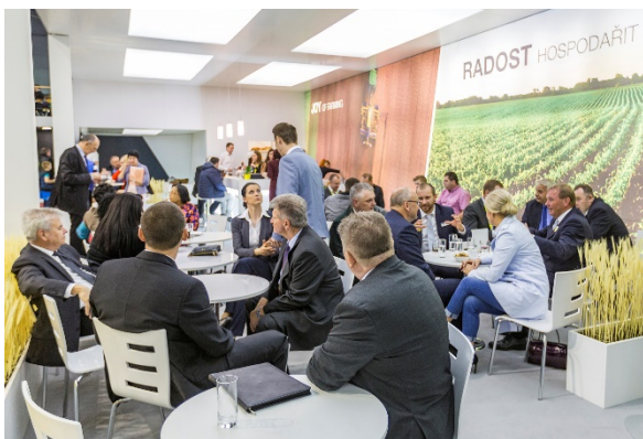
Posazení pro zákazníky a hosty na stánku