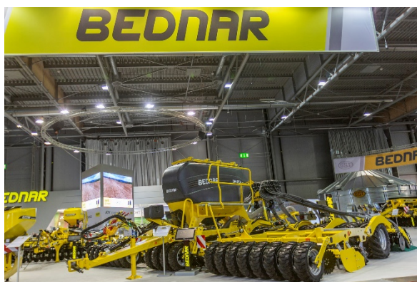
OMEGA OO 8000L v hale P na stánku společnosti BEDNAR FMT

TERRASTRIP ZN 8R/45 je nový osmiradličný dlátový pluh s meziřádkovou vzdáleností 45 cm. Konkrétně slouží pro řádkové zpracování půdy. Ideální je pro zpracování půdy porostů cukrové řepy a kukuřice.