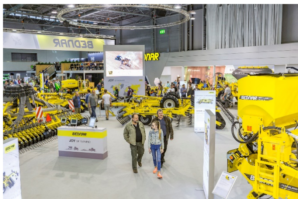
Výstavní plocha společnosti BEDNAR

Posledním strojem, který si na TECHAGRU v Brně odbyl svou premiéru, je inovovaný předsetový kompaktor SWIFTER SO 6000 Profi. Ten dokáže během jediného přejezdu připravit pozemek pro výsev. Umožňuje práci ve vysokých pracovních rychlostech až 15 km/h a jeho velkou výhodou je celkové odpružení pracovních rámců.