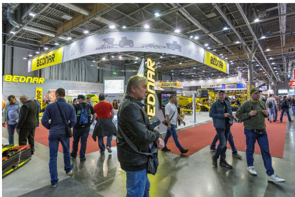
Stánek BEDNAR na TECHAGRU v Brně

Veletrh TECHAGRO se koná v Brně jednou za dva roky. Jedná se o největší výstavu zemědělské techniky ve střední Evropě, která letos proběhla od 8. do 12. dubna. Celkem své produkty představilo 724 vystavovatelů z 37 zemí a navštívilo ji více než 110 000 návštěvníků.