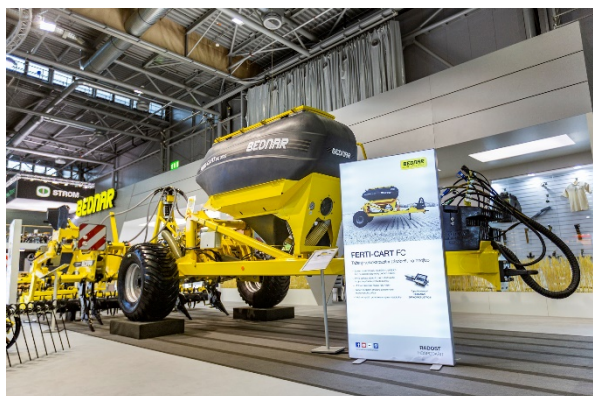
TERRASTRIP ZN 8R/45 ve spřažení s FERTI-CART FC 3500

Společnost BEDNAR FMT na veletrhu ukázala také nejnovější univerzální radličkový kypřič VERSATILE VO 7500. Hodí se k předsetové přípravě půdy na pozemcích s větším množstvím posklizňových zbytků nebo k intenzivní podmítce strniště do 15 cm.