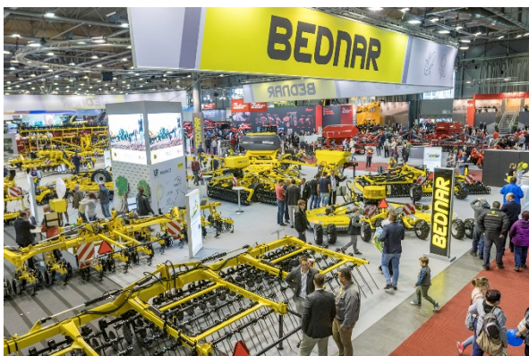
Společnost BEDNAR FMT vystavovala na ploše o velikosti 1236 m 2

V průběhu výstavy se mohli zákazníci setkat s obchodními zástupci pro svůj region. Na výstavě samozřejmě nechyběli zástupci pro vybrané evropské trhy, ale na své si přišli i návštěvníci z dalších světových destinací. Informovat o novinkách a portfoliu strojů BEDNAR FMT byli připraveni všichni obchodní zástupci.