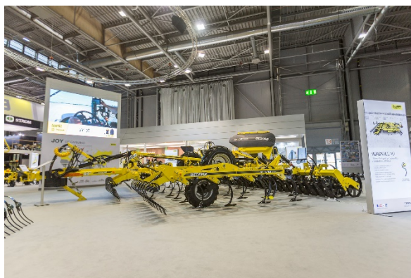
VERSATILE VO 6000

Posledním strojem, který si na TECHAGRU v Brně odbyl svou premiéru, je inovovaný předsetový kompaktor SWIFTER SO 6000 Profi. Ten dokáže během jediného přejezdu připravit pozemek pro výsev. Umožňuje práci ve vysokých pracovních rychlostech až 15 km/h a jeho velkou výhodou je celkové odpružení pracovních rámců.