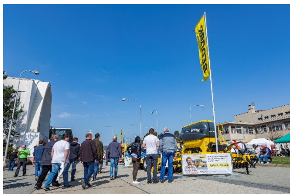
U hlavní brány jste si mohli prohlédnout secí stroj OMEGA OO 6000L