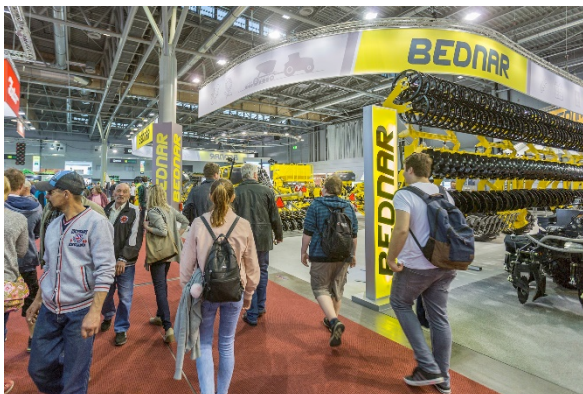
Stánek byl v neustálém obležení návštěvníků