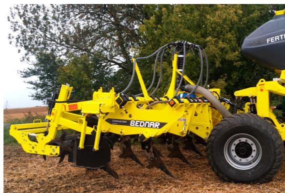
Демонстрация Swifterdisc в работе на выставке

BEDNAR представила навесной агрегат Terraland TO 6000 на AG MOTION, крупнейшей выставке в Альберте и Саскачеване, где в Саскачеване машина обработала десятки участков, получив высочайшую оценку фермеров. Метод глубокого рыхления, которым на данный момент пользуются ведущие канадские сельскохозяйственные производители Pentagon (Альберта) и Pattison AG (Саскачеван), произвел настоящую революцию.