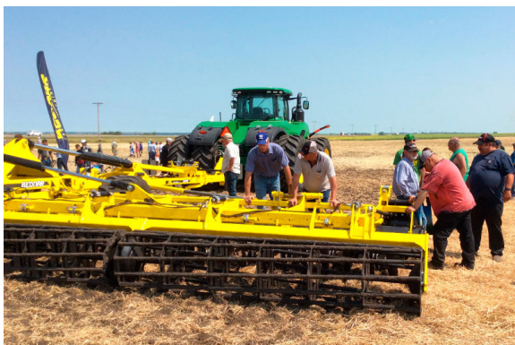
Машины BEDNAR на AG MOTION в Альберте

В отличие от США канадские фермеры все больше отдают предпочтение европейским методам культивации почвы. Первым агрегатом, добившимся успеха в Канаде, стал узкий дисковый лущильщик, дополнивший популярную линейку Zero Tillage. Узкий лущильщик SWIFTERDISC пользуется популярностью во всей Канаде – от Альберты до Манитобы и Квебека. В прошлом году компания BEDNAR отправила первую машину Terraland в Альберту для тестирования. Машину использовали для культивации почвы осенью. Поля, обработанные при помощи Terraland, можно было сразу использовать под посевы благодаря быстрому выходу излишков влаги весной. Канадские фермеры полагают, что раннее укоренение растений стало основной причиной увеличения урожая канолы на 20 % (яровой рапс).