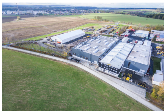
Завод по изготовлению сельскохозяйственных машин в Рихнове-над-Кнежноу, Чешская республика