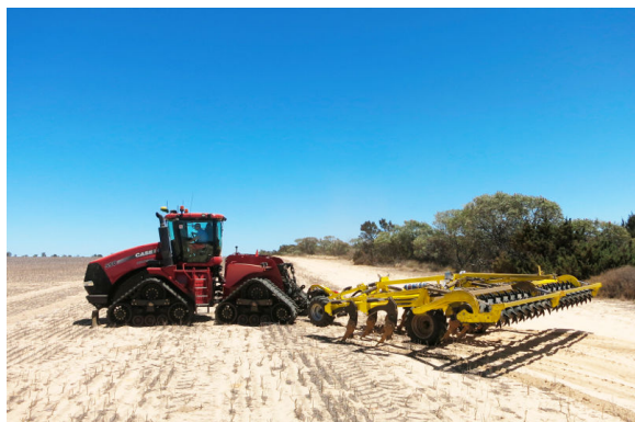
Terraland TO, соответствующий требованиям системы CTF в Австралии