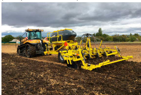
TerraStrip v pracovním nasazení na Ukrajině

Zatímco zemědělci v západní části Evropy jsou spíše konzervativnější a věří v postupy, které zdědili po předcích, zemědělci z „východu“ jsou mnohem otevřenější novým technologiím a hledáním cest, které vedou ke zvýšení výnosů. BEDNAR dodal během roku 2017 několik ucelených technologických linek pro profilové hnojení a hluboké kypření jak do Ruska, tak na Ukrajinu. Agro holdingy na Ukrajině jdou ještě dál a začínají používat metodu TerraStrip, která spočívá v podzemním profilovém hnojení přímo pod řádkové kultury.