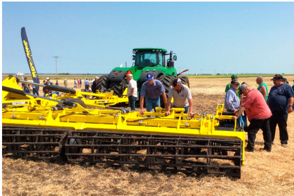
Stroje BEDNAR na AG MOTION v Albertě

V Kanadě, na rozdíl od USA, se čím dál více prosazují metody zpracování půdy pocházející z Evropy. První typ stroje, který se v Kanadě prosadil, jsou tzv. krátké disky, které začínají doplňovat doposud tolik populární Zero Tillage. Krátké disky SWIFTERDISC jsou populární od Alaberty přes Manitobu až po Quebec. Minulý rok BEDNAR poslal na testování do Alaberty první Terraland, kterým byla půda zpracována na podzim. Pozemky zpracované Terralandem mohly být díky rychlému jarnímu ústupu vysoké vlhkosti rychle osety. Podle kanadských farmářů bylo brzké založení porostů hlavním důvodem o 20 % vyšší sklizně tzv. canoly (jarní řepky).