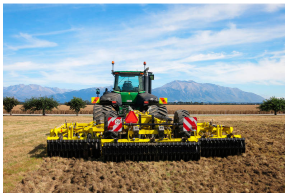
Atlas při práci na Novém Zélandě