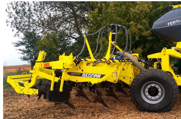
Praktická ukázka práce Swifterdiscu na výstavě

Na největší výstavě AG MOTION v Albertě a v Saskachewanu BEDNAR představil tažený Terraland TO 6000, který zpracoval v Saskachewanu desítky parcel k maximální spokojenosti farmářů. Metoda hlubokého kypření, kterou nyní zavádíme s předními kanadskými dealery Pentagon (Alberta) a Pattison AG (Saskatchewan), je přelomová.