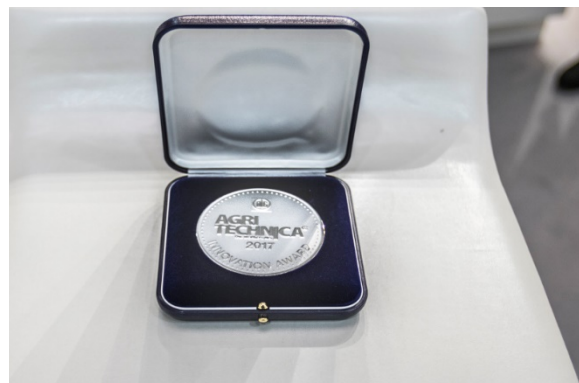
Първи сребърен медал за Чешката република от международното изложение Агритехника