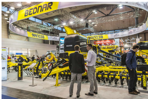
OMEGA OO 8000L

BEDNAR pokazał również całkowicie nową maszynę, to FERTI-CART FC 3500. Jest to podciśnieniowy wóz nawozowy o pojemności 3500 l. Jest bardzo przydatny podczas bezpośredniego nawożenia profilu glebowego.