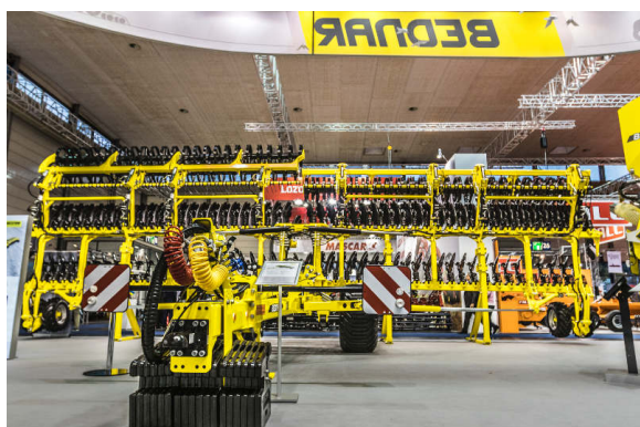
ATLAS AE 12400

Ostatnią nowością pokazaną na targach w Hanowerze był agregat przedsięwny SWIFTER SO 6000L. Maszyna jest w stanie w jednym przejeździe przygotować glebę pod siew. Wielką zaletą jest zawieszenie sekcji roboczych na sprężynach przeciążeniowych, co pozwala na pracę przy wysokich prędkościach do 15 km/h.