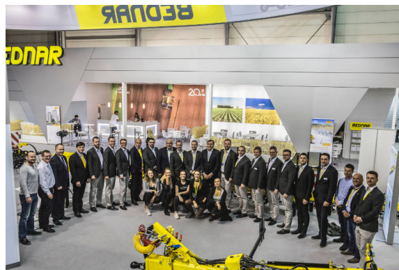
BEDNAR Team na największych targach AGRITECHNICA w Hanowerze, w Niemczech.