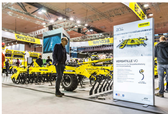
VERSATILE VO 6000

ATLAS AE 12400 to nowa brona talerzowa do gospodarstw, gdzie wymagana jest ogromna dzienna wydajność przy ograniczaniu kosztów produkcyjnych. Maszyna posiada talerze robocze ułożone w kształcie „X”, co zapobiega bocznym odchyleniom w stosunku do toru jazdy podczas wysokich prędkości pracy. Kolejnym atutem jest umiejscowienie osi transportowej z przodu sekcji roboczej.