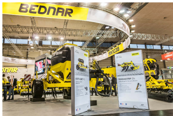
FERTI-CART FC 3500

A sávművelő kultivátorok termékcsaládjának legelső tagja a TerraStrip ZN 8R/45. Egy 8 kapával szerelt, 45 cm-es sortávolságra vetett kultúrák esetén alkalmazható kultivátorról van szó. A teljes felületű forgatásos művelés elhagyásával jelentősen csökkenthető a víz- és szélerosztó mértéke. A művelet hatékonyságát műtrágya egyidejű kijuttatásával lehet növelni. A vetési sávban dolgozó lazítókapák nem csupán a talaj átműveléséért felelnek, hanem egy menetben műtrágyát is képesek kijuttatni egyenesen a gyökérszónába.