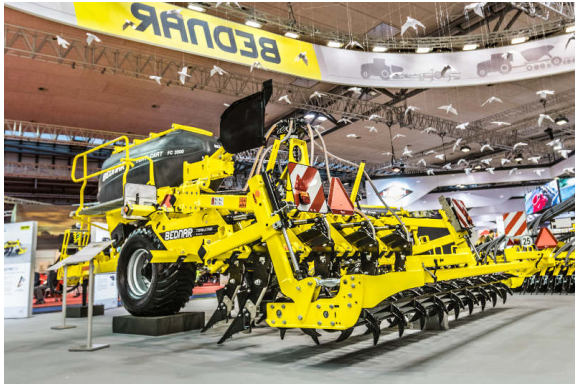
TERRASTRIP ZN 8R/45 és FERTI-CART FC 3500

tarlólánhátásra a vízszintes rugós biztosítású kapáknak köszönhetően. A kapák 5 sorban helyezkednek el a gépen. Az átfedéssel szerelt lúdtalp kapák a talajt a teljes felület mentén átművelik. A futómű a gép központi vázába van integrálva, ami stabil munkavégzést és kisebb fordulási sugarat tesz lehetővé.