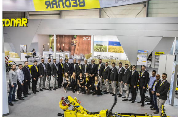
A BEDNAR értékesítési csapata az AGRITECHNICA 2017 kiállításon