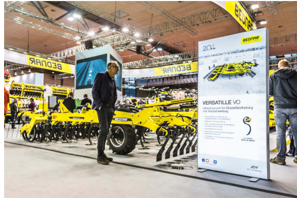
VERSATILE VO 6000

Az újdonságok sorát az ATLAS AE rövidtárcsa folytatta. Ez egy nehéz, kompakt kialakítású, nagy munkaszélességű tárcsás tarlólánhátó, amely nagy napi területteljesítmények elérését teszi lehetővé. A gép 610 mm átmérőjű tárcsalapokkal van szerelve, melyek „X” alakba vannak rendezve. Ez a műszaki megoldás kiküszöböli a tárcsa oldalirányú elmozgását. A futómű a tárcsaszorok előtt helyezkedik el, ezáltal a gép nem pattog munkavégzés közben.