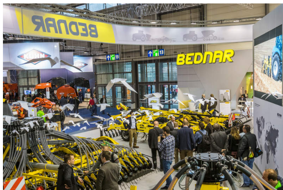
A VERSATILE VO 6000 sajtóbemutatója