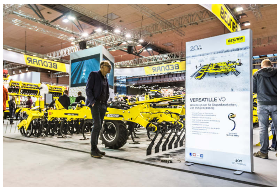
VERSATILE VO 6000

La machine ATLAS AE 12400 est un nouveau déchaumeur à large prise qui est capable de fournir des rendements journaliers élevés à moindres frais. Cette machine se démarque par le fait que ses disques sont agencés en X, ce qui empêche la machine de drifter. La position de l'essieu de transport devant les disques de travail est un autre avantage de cette machine.