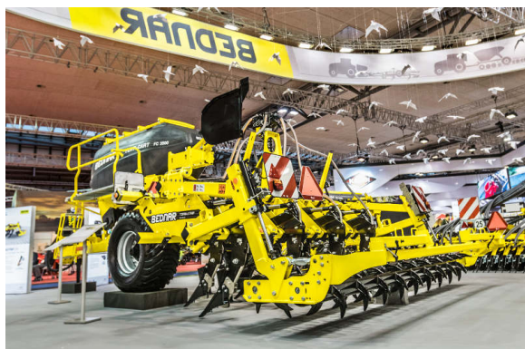
La machine TERRASTRIP ZN 8R/45 attelée à une machine FERTI-CART FC 3500