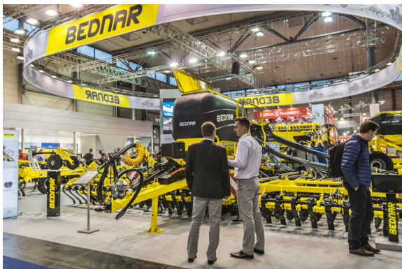
OMEGA OO 8000L

La machine FERTI-CART FC 3500 est une totale nouveauté qui a été présentée au salon. Il s'agit d'un véhicule-trémie à surpression, d'un volume de 3 500 l. Elle est utilisée pour appliquer directement et confortablement de l'engrais dans l'horizon du sol.