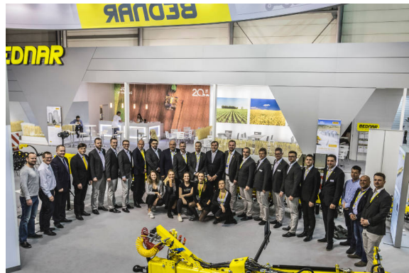
L'équipe BEDNAR présente au plus grand salon mondial AGRITECHNICA qui s'est tenu à Hanovre, en Allemagne