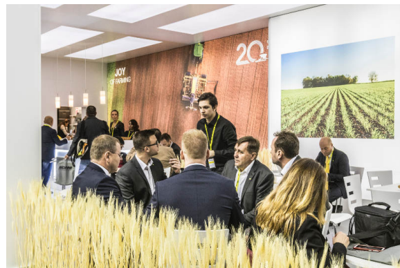
Espace d'accueil des clients et des invités venus sur le stand