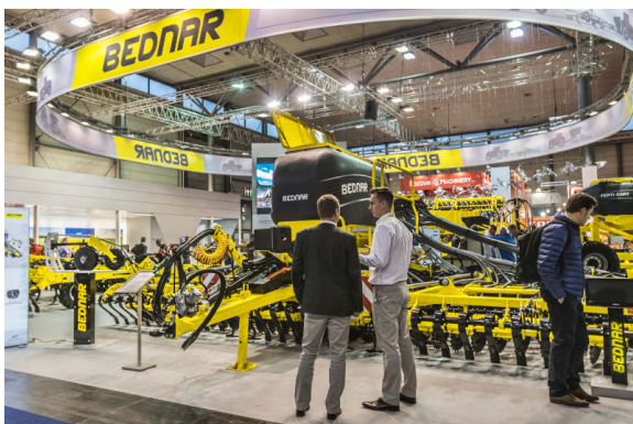
OMEGA OO 8000L

Eine komplette Neuheit stellte die vorgestellte Maschine FERTI-CART FC 3500 dar. Es handelt sich um einen Überdruck-Vorratswagen mit 3 500 l Volumen. Er dient für das bequeme direkte Applizieren von Düngern in die Bodenschichten.