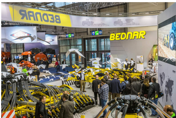
Journalisten erhalten Informationen über den neuen VERSATILE VO 6000