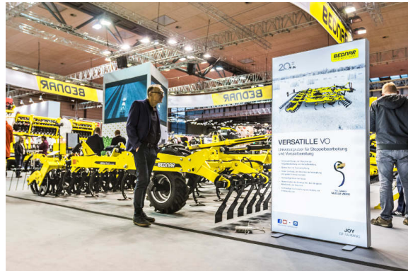
VERSATILE VO 6000

Der ATLAS AE 12400 ist eine neue Scheibenegge mit großer Arbeitsbreite für hohe Tagesleistungen und Kostenersparnis. Die Maschine zeichnet sich durch eine X-Stellung der Scheiben aus, die das Abdriften verhindert. Ein weiterer Vorteil ist die Positionierung der Transportachse vor den Arbeitsscheiben.