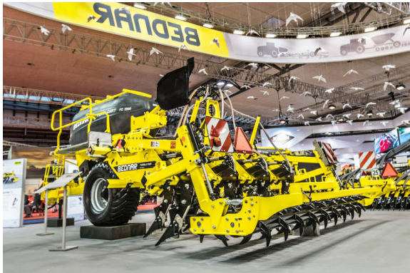
Der TERRASTRIP ZN 8R/45 im Gespann mit dem FERTI-CART FC 3500