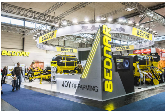
Der BEDNAR-Stand in Halle 12 auf der AGRITECHNICA

Die Messe AGRITECHNICA wird alle zwei Jahre in Hannover veranstaltet. Es handelt sich um die größte und auch längste Veranstaltung ihrer Art weltweit. Dieses Jahr fand sie vom 12. bis zum 18. November statt, insgesamt also eine ganze Woche. Die Firma BEDNAR stellte hier 6 neue Maschinen vor.