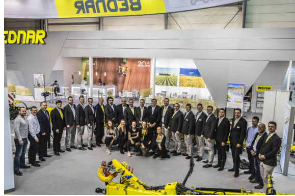
Das BEDNAR-Team auf der weltgrößten Ausstellung AGRITECHNICA in Hannover