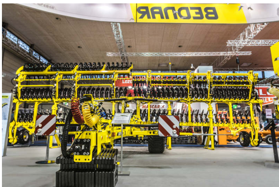
ATLAS AE 12400

Die letzte Maschine, die in Hannover ihre Premiere feierte, ist der innovative Saatbettkompaktor SWIFTER SO 6000L. Dieser kann in einem einzigen Arbeitsgang das Feld für die Aussaat vorbereiten. Sein großer Vorzug ist eine Vollfederung der Arbeitsrahmen. Diese ermöglicht einen Betrieb bei hohen Arbeitsgeschwindigkeiten von bis zu 15 km/h.