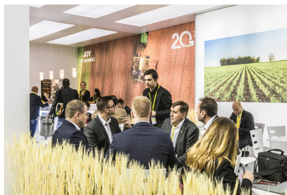
Posezení pro zákazníky a hosty na stánku