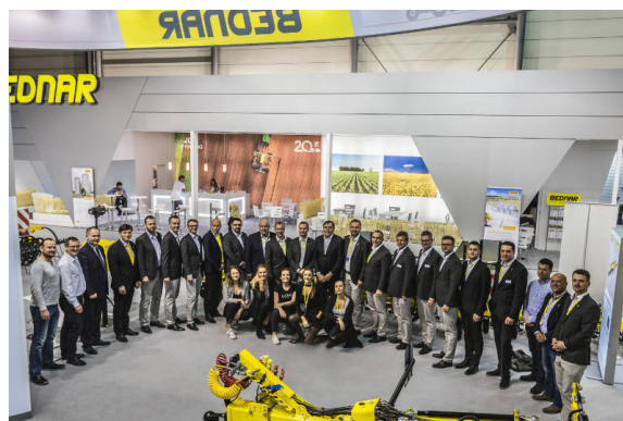
BEDNAR Team na největší světové výstavě AGRITECHNICA v německém Hannoveru