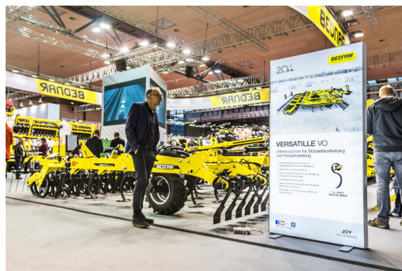
VERASTILE VO 6000