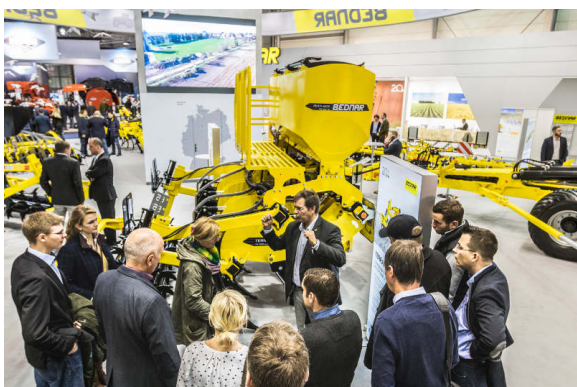
Josef Schlueter, obchodní zástupce pro Německo, seznamuje s výhodami stroje TERRALAND ve spojení s FERTI-BOXEM FB 1500