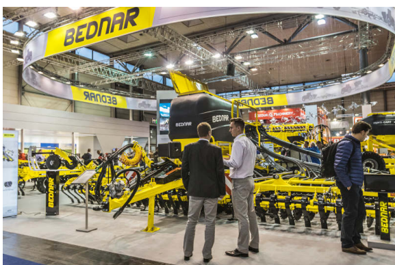
OMEGA OO 8000L

BEDNAR въведе и съвсем нова машина: FERTI-CART FC 3500. Това е херметизиран бункер с вместимост от 3500 литра. Използва се за удобно директно полагане на торове в почвените хоризонти.