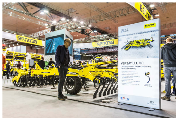
VERSATILE VO 6000

ATLAS AE 12400 е нов широк култиватор за стърница за високи ежедневни резултати с икономия на разходите. Машината има дискове, подредени във форма X, което предотвратява появата на приплъсващ ефект. Друго предимство е монтирането на транспортната ос пред работните дискове.