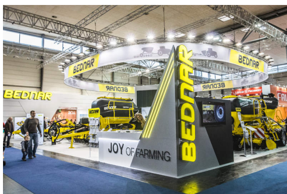
Щанд на BEDNAR в Палата 12 на АГРИТЕХНИКА

Изложението АГРИТЕХНИКА се провежда веднъж на всеки две години в Ханوفر, Германия. Това е най-голямото, но и най-дългото събитие по рода си в света. Тази година изложението се проведе от 12 до 18 ноември. На него BEDNAR представи 6 нови машини.