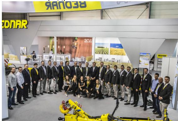
Екипът на BEDNAR на най-голямото световно изложение АГРИТЕХНИКА в Ханوفر, Германия