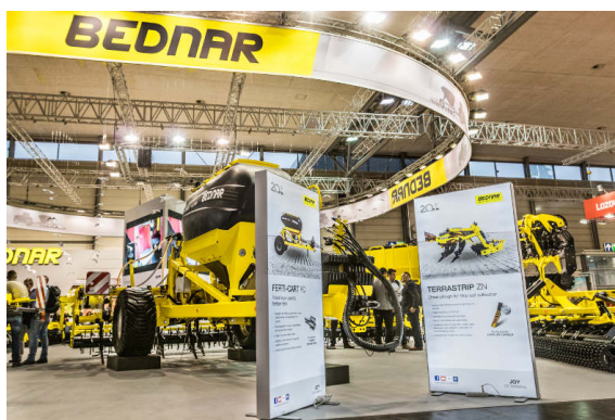
FERTI-CART FC 3500

TERRASTRIP ZN 8R/45 е нова машина за обработка почвата по редове. Това е плуг с осем отметателни дъски с лемеж с междуредово разстояние 45 см, идеален за обработка на захарно цвекло.