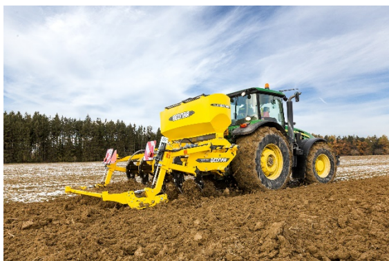
FERTI-BOX FB 1500 TN емкостью 1500 л можно монтировать как на новые, так и на используемые в настоящее время рыхлительные культиваторы TERRALAND.

Благодаря FERTI-BOX можно вносить удобрения при обработке почвы. FERTI-BOX FB 1500 TN предназначена для современных и будущих пользователей рыхлительных культиваторов TERRALAND TN. Коробка емкостью 1500 литров встроена непосредственно в раму рыхлительного культиватора. Удобрение доставляется на дозирующее устройство винтовым конвейером, а оттуда — на концевые части рыхлительного культиватора. Электронный привод и машина, работающая под давлением, обеспечивают надежное внесение удобрений.