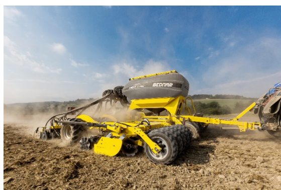
Сеялки OMEGA OO_L оснащены дисками диаметром 460 мм