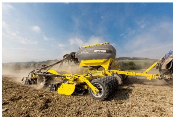
Az OMEGA OO_L modellek 460 mm-es tárcsalapokkal vannak szerelve.