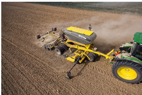
A vetőgépek új generációja, az OMEGA OO_L, polietilénből gyártott magtartállyal rendelkezik; 3 és 6 m-es munkaszélességekben lesz elérhető.

Az OMEGA OO_L az előző verzióval szemben már 460 mm-es tárcsalapokkal van ellátva. A kisebb átmérőjű lapok nagyobb kerületi sebességet érnek el, ami jobb minőségű magágyelőkészítést tesz lehetővé. Az OMEGA OO_L modelleket is fel lehet szerelni hullámos tárcsával, amely elsősorban nehéz, kötött talajokon jelent hatalmas minőségbeli előrelépést.