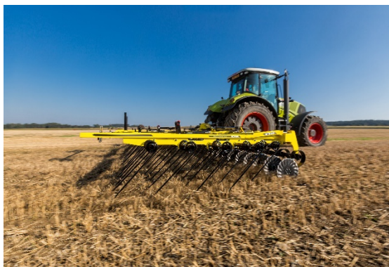
Polní brány STRIEGEL-PRO PN budou v nabídce s pracovním záběrem 6, 7,5 a 9 metrů

Vysoký výnos vyžaduje precizní provedení všech pracovních operací. Prutové brány v novém neseném provedení STRIEGEL-PRO PN představují efektivní pomoc s managementem posklizňových zbytků, což je operace, u které vše důležité začíná. Mnoho subjektů zemědělské prvovýroby jsou zaměřené na rostlinnou produkci. Rozumným řešením je posklizňové zbytky vrátit do půdy a tím pomoci zvýšit podíl organického materiálu v půdě. Prutové brány posklizňové zbytky nařežou a rovnoměrně rozprostřou po pozemku. Dají tak následujícím strojům větší šanci poradit si s velkým množstvím materiálu. Navíc do půdy dostanou výdrol v podobě semen, která je po vzklíčení neúčinnější zlikvidovat mechanickou cestou. Prutové brány mohou najít širší uplatnění. Farmáři je s radostí používají také při předseťové přípravě pro otevření půdy a zajištění jejího rychlejšího prohřátí nebo na trvalých travních porostech pro odstranění travní plsti a celkovou regeneraci luk.